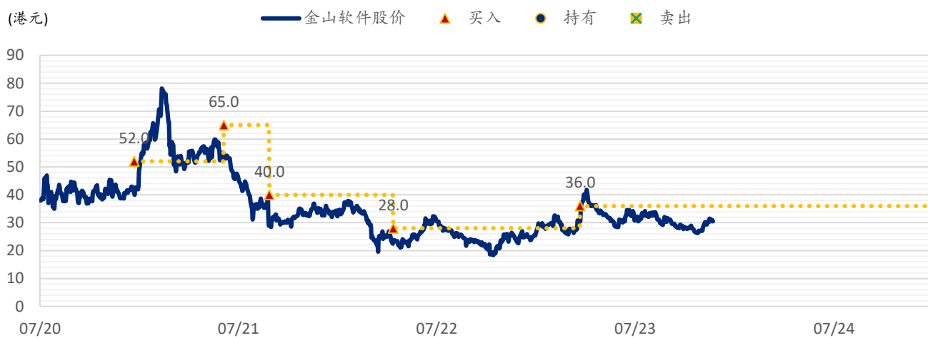
图表 2: SPDBI 目标价: 金山软件