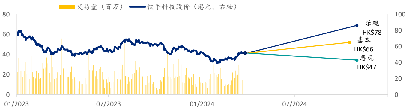
图表 5: 快手 SPDBI 情景假设