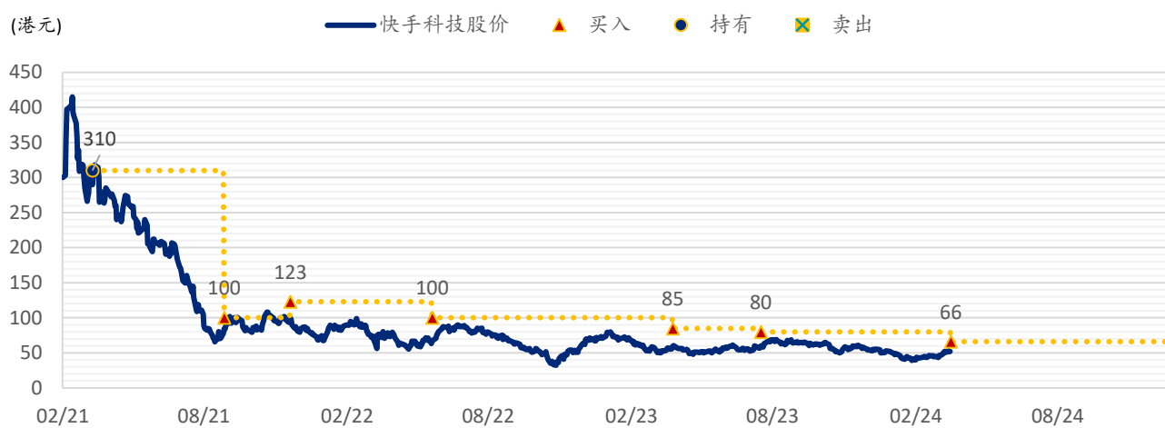
图表 3: SPDBI 目标价: 快手