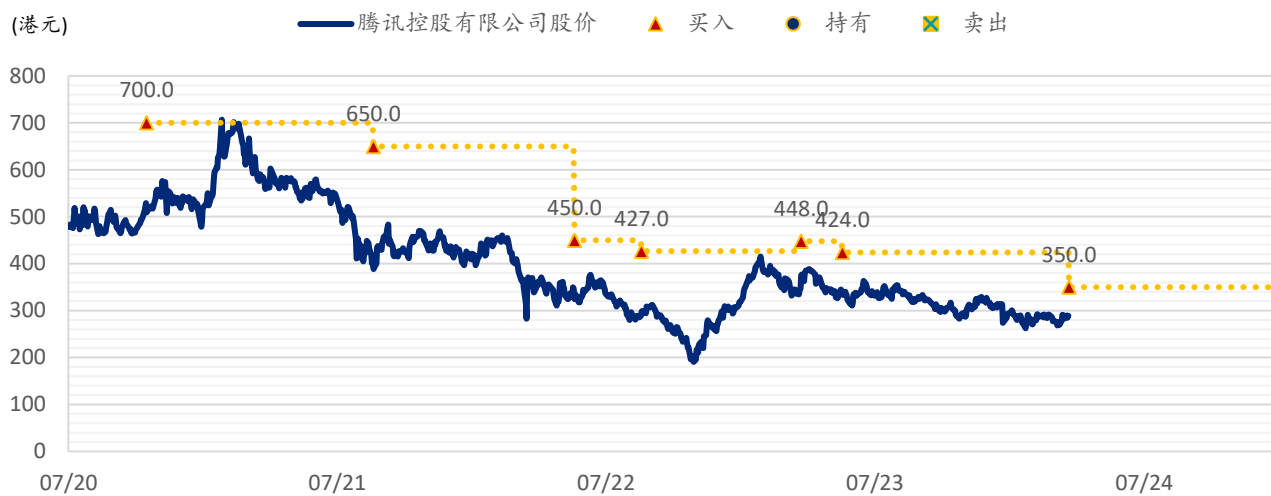
图表 3：浦银国际目标价：腾讯