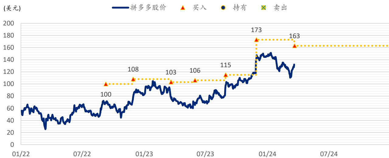
图表 3：浦银国际目标价：拼多多（PDD.US）

注：截至 2024 年 3 月 20 日收盘