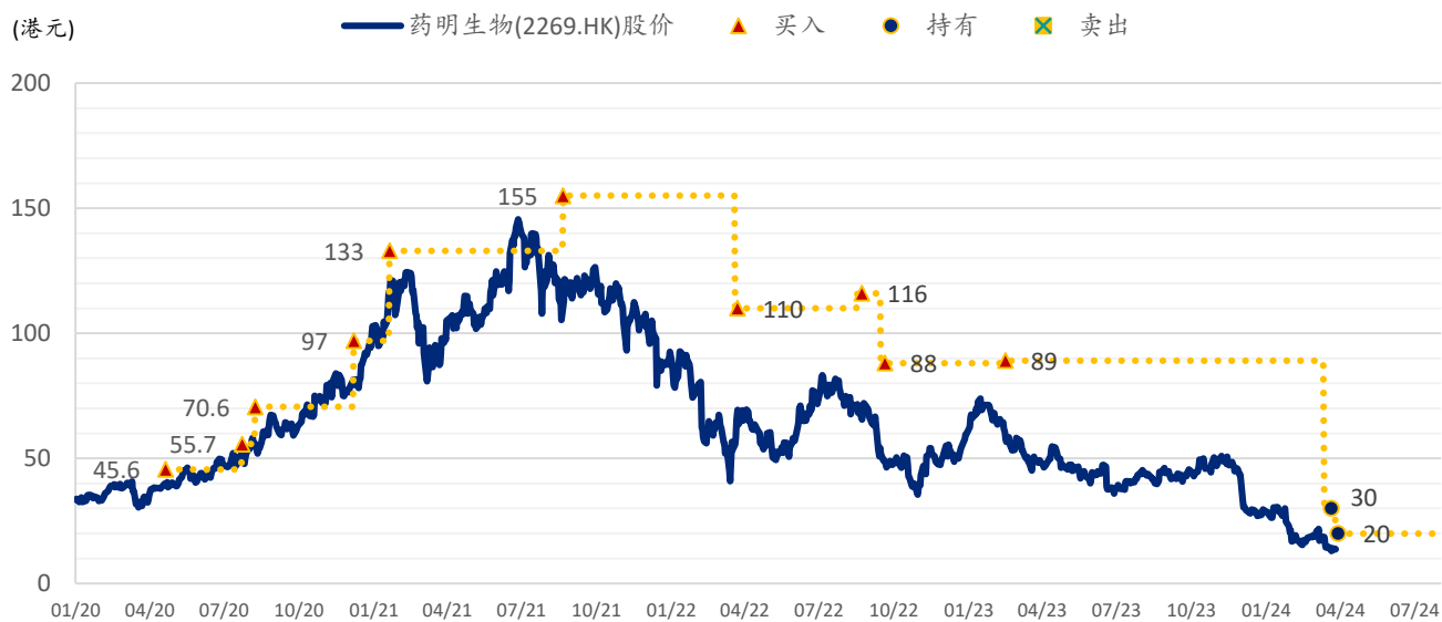
图表 3: 浦银国际目标价: 药明生物 (2269.HK)