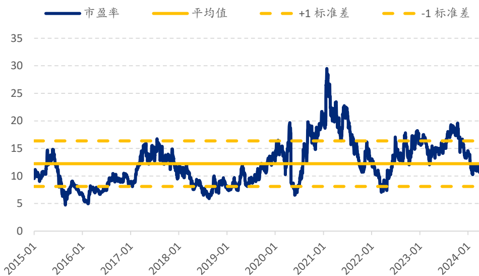
图表 2: 比亚迪电子 (285.HK): 市盈率估值 (x)