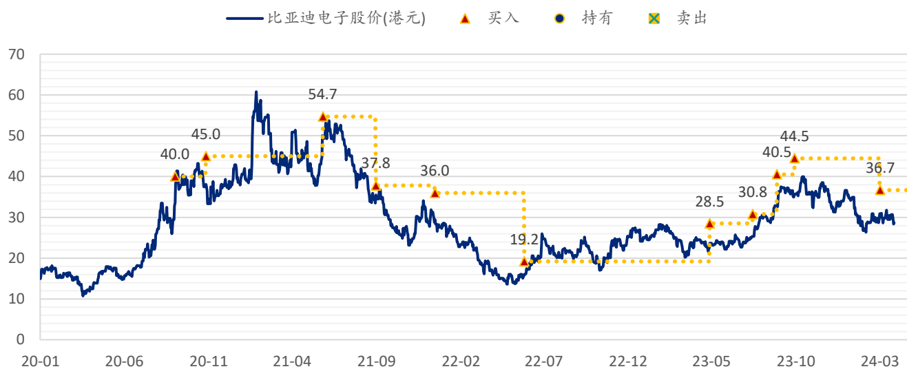
图表 3: SPDBI 目标价: 比亚迪电子 (285.HK)