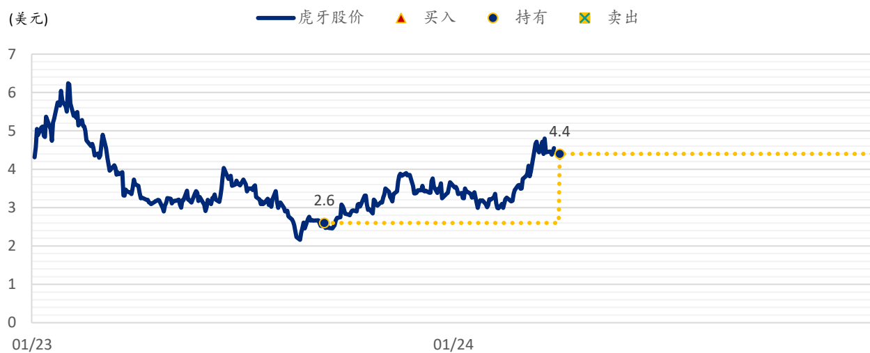
图表 2：浦银国际目标价：虎牙 (HUYA.US)

注：截至 2024 年 4 月 1 日收盘价