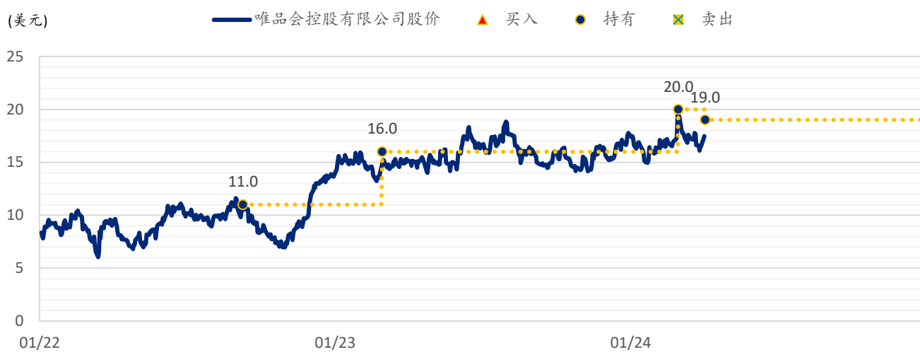
图表 2：浦银国际目标价：唯品会 (VIPS.US)