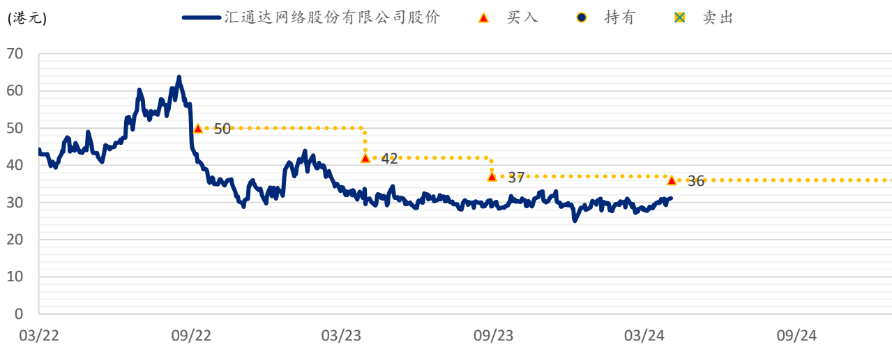
图表 2：浦银国际目标价：汇通达（9878.HK）